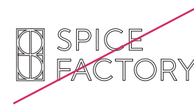
アウトラインで表示しない