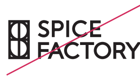
ロゴの太さを変えない