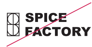
ロゴの書体を変えない