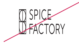
縦横幅を変えない

ロゴは正しく使用されることによって、初めて本来の機能を発揮し、イメージを正しく伝達することができます。表記のような誤った使用は避けてください。