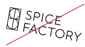
斜め角度で使用しない