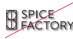
陰影をつけて表示しない