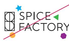
周りにその他の図形を表示しない