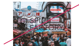
不明瞭な表示をしない