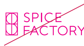
指定以外の色を使用しない