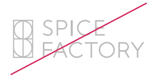
不透明度を変えて使用しない